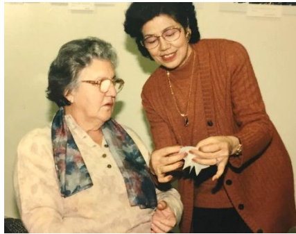
Intercambio ciudadano en Sevilla en 1998

2ª: Los japoneses sienten una profunda emoción por la belleza natural de las cuatro estaciones. Después de pasar un duro invierno, esperan con pasión especial el clima agradable de primavera, cuyo símbolo es la flor de cerezo.