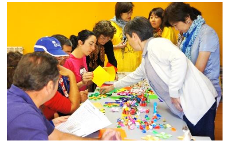
Intercambio ciudadano en Bierzo en 2015