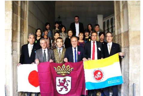
Visita a la diputación de León en 2015