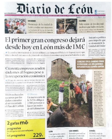
Plantación en castillo Ponferrada en 2018

Dirección : 2-18-4 Kishiya Tsurumi-ku Yokohama