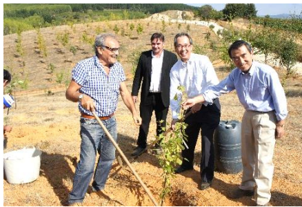
Plantación de cerezo en Canedo en 2015