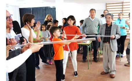
Intercambio ciudadano en colegio en 2017