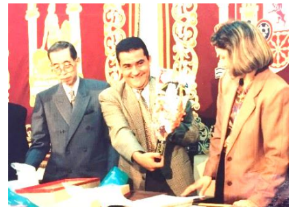
Visita al ayuntamiento de Coria del Río en 1995