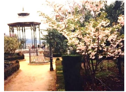
Cerezo de Ronda en 2005