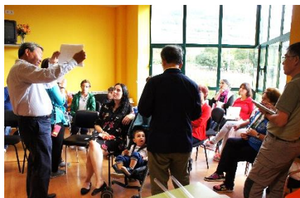
Intercambio ciudadano en Bierzo en 2017