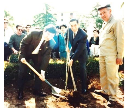
Plantación de cerezo en Ronda en 1993

Se realizan charlas culturales sobre la historia y la literatura de España a cargo de expertos con profundos conocimientos. También se organizan conciertos de música española y clases de cocina española (la comida preparada durante la clase se disfruta al final).