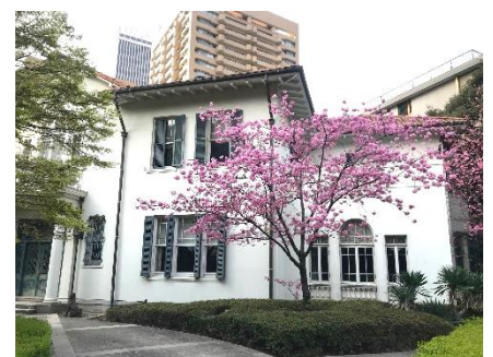
Cerezo en la Embajada de España en Tokio plantado en 2005