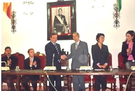
Visita al ayuntamiento de Ronda en 2005